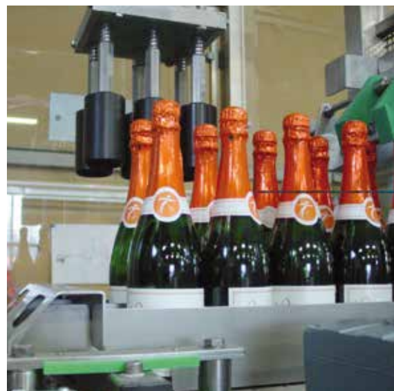
Укладчик VARI с одной головкой для бутылок для игристых вин