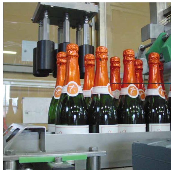
Einpacker VARI-Ein-Kopf für Sektflaschen