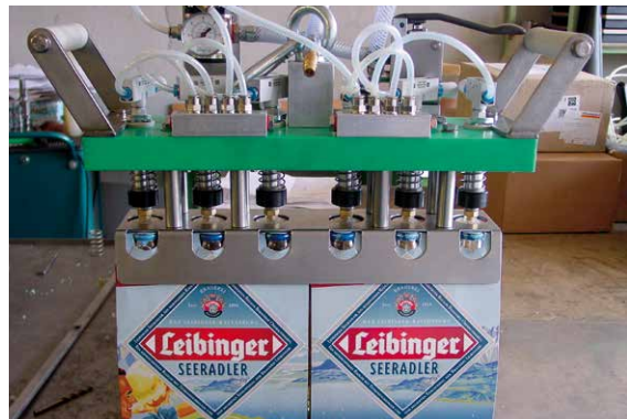
Spezial-Handpackkopf zum Umpacken von 2 Sixpack-Verpackungen in Pinolenkasten