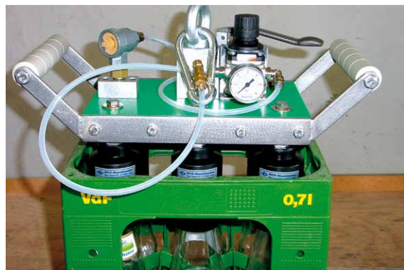
6er Handpackkopf für 0,7l VdF-Flaschen