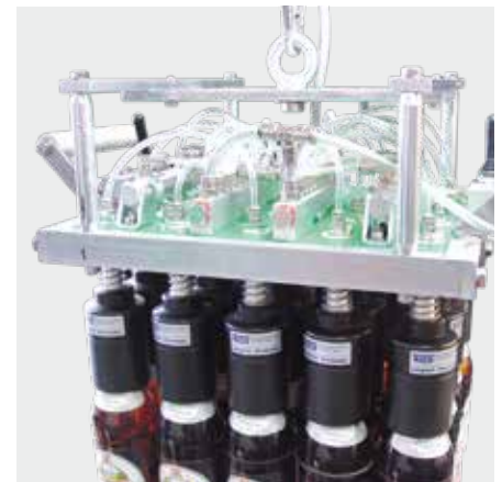
20er Handpackkopf für 0,5l Euro-Flaschen