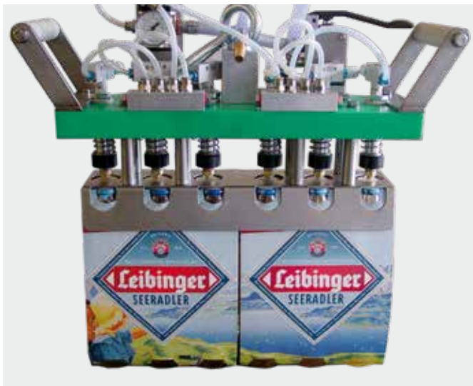
Spezial-Handpackkopf zum Umpacken von zwei Sixpack-Verpackungen in Pinolenkästen